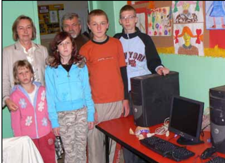
Bezpłatne przekazanie sprzętu komputerowego dzieciom i młodzieży

Zwłaszcza sprzęt komputerowy cieszył się dużą popularnością wśród niezamożnych mieszkańców powiatu buskiego, których nie stać jest na zakup nowych komputerów. Centrum zwróciło się do centrali największych banków działających w Polsce z prośbą o przekazanie używanego sprzętu komputerowego.