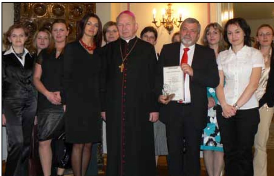
Nagroda Lodołamacza – Pałac Zielińskich, Kielce 2009 rok