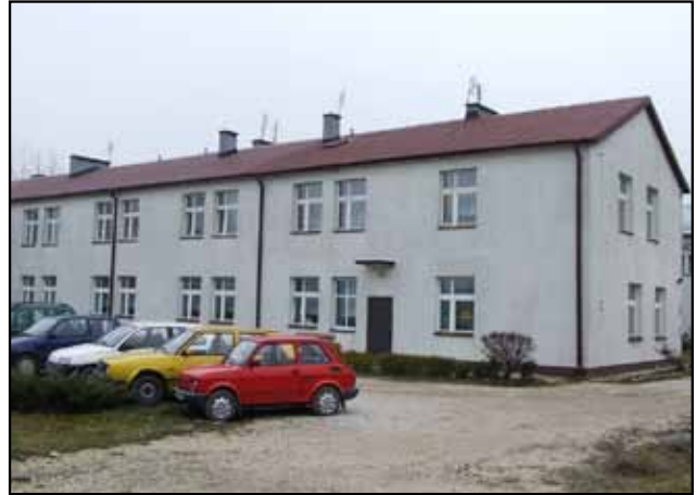
Dom Pomocy Społecznej w Ratajach

DPS RATAJE SŁUPSKE – przeznaczony jest dla osób starych. Placówka dysponuje 35 miejscami. Podmiotem prowadzącym jest Caritas Diecezji Kieleckiej (umowa z samorządem powiatu na finansowanie jednostki).