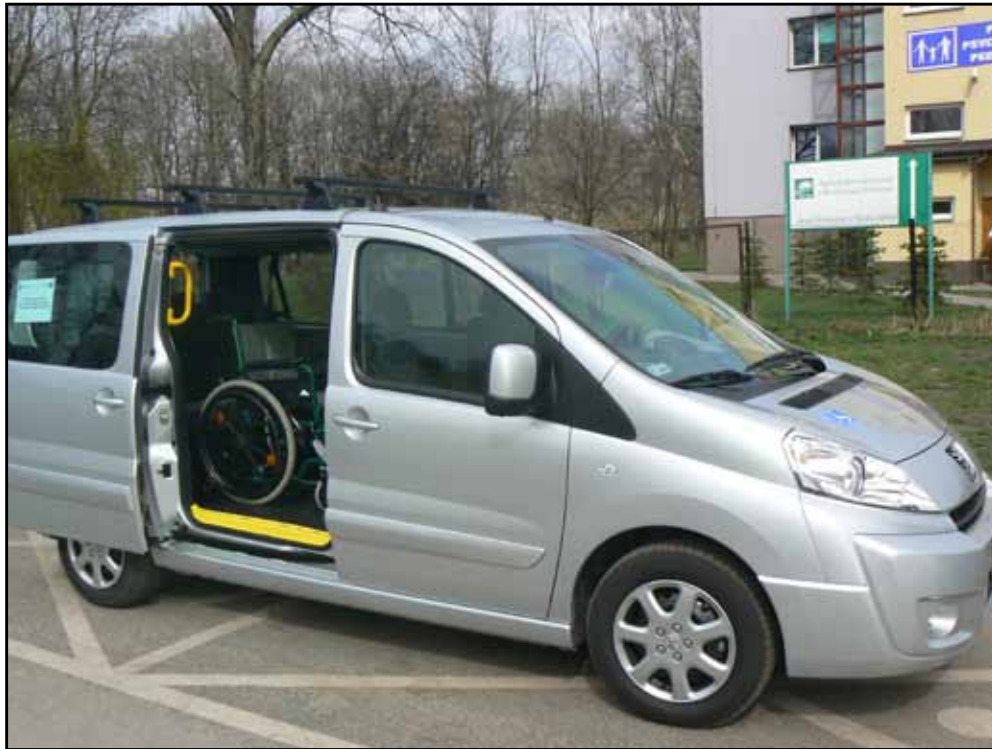
Samochód przystosowany do przewozu osób niepełnosprawnych

W kwietniu 2011 roku zakupiony został środek transportu do przewozu osób niepełnosprawnych, dzięki któremu możliwe będzie dowożenie osób mających trudności z poruszaniem się na zajęcia szkoleniowe.