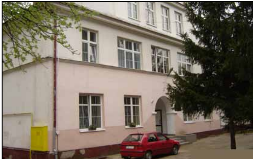
Placówka Opiekuńczo-Wychowawcza w Winarach

W jej skład wchodzi 3 mieszkania autonomiczne oraz Rodziny Pogotowie Interwencyjno – Opiekuńcze. Na poddaszu budynku przygotowane zostały do otwarcia mieszkania chronione.