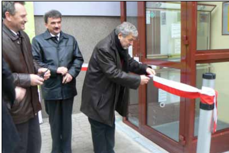
Uroczyste otwarcie platformy przy siedzibie PCPR w Busku – Zdroju

W „Zasadach finansowania Programu Operacyjnego Kapitał Ludzki” zawarta jest informacja, że wydatki ponoszone w ramach cross-financingu powinny zostać przeznaczone przede wszystkim na zapewnienie realizacji zasady równości szans, w szczególności w odniesieniu do potrzeb osób niepełnosprawnych. W roku 2010 Centrum zdecydowało, że całość kwoty cross-financingu przeznaczy na adaptację budynku do potrzeb osób niepełnosprawnych. W tym celu zamontowana została platforma do przewozu osób niepełnosprawnych. Centrum chciało w ten sposób odpowiedzieć na potrzeby tych wszystkich klientów, którzy mają problemy z poruszaniem się.