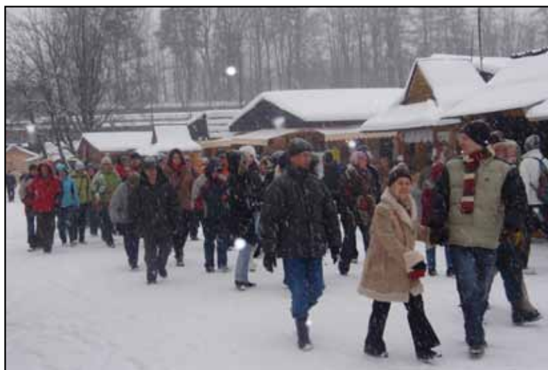
Uczestnicy wyjazdu integracyjno – szkoleniowego. Zakopane, grudzień 2010