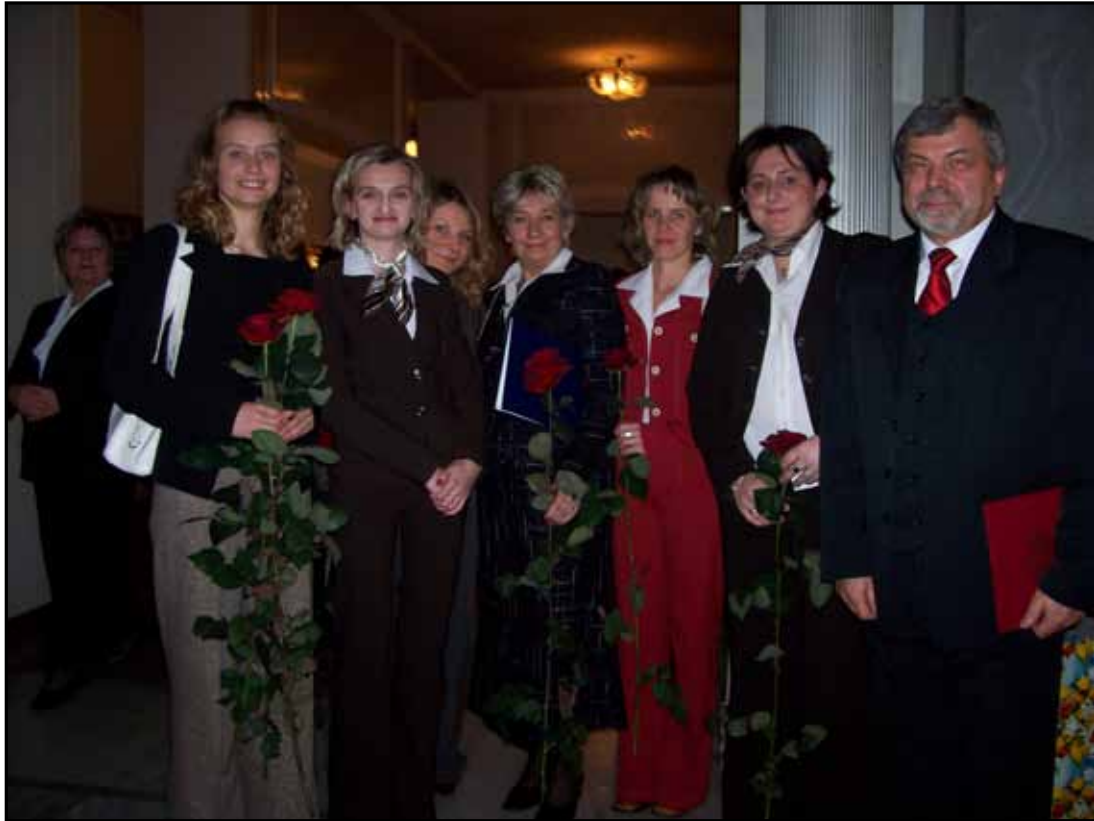
Wręczenie nagrody Ministra Pracy i Polityki Społecznej – Warszawa 2005 rok.

W 2007 roku PCPR otrzymało od Polskiej Organizacji Pracodawców Osób Niepełnosprawnych tytuł Lodołamacz 2007 „za szczególną wrażliwość społeczną i odpowiedzialną politykę personalną uwzględniającą potrzeby osób niepełnosprawnych”. Statuetkę odebrano podczas uroczystej gali finałowej w Krakowie, w dniu 18.04.2007 r. Po raz kolejny Centrum otrzymało Statuetkę Lodołamacza za I miejsce w kategorii Pracodawca Nieprzedsiębiorca w 2009 roku. Zdaniem Kapituły działalność PCPR w Busku – Zdroju na polu rehabilitacji zawodowej i społecznej osób niepełnosprawnych stanowi wzór godny naśladowania. Uroczysta gala wręczenia statuetek odbyła się 28 kwietnia 2009 roku w Pałacyku Zielińskich w Kielcach.