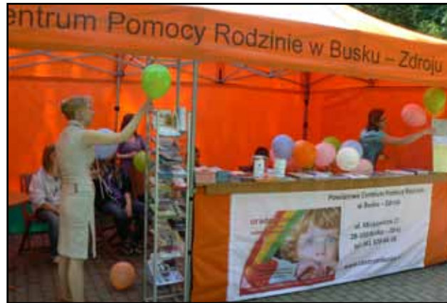
Stoisko Informacyjne Powiatowego Centrum Pomocy Rodzinie w Busku – Zdroju, obok Muszli Koncertowej w Parku Zdrojowym

Dzięki akcji propagującej rodzicielstwo zastępcze kilkadziesiąt osób zgłosiło się do Centrum, aby poszerzyć wiedzę na ten temat. Ponadto Powiatowe Centrum Pomocy Rodzinie w Busku–Zdroju rokrocznie uczestniczy w dożynkach gminnych i powiatowych, podczas których promuje działania Centrum oraz Rodzicielstwo Zastępcze.