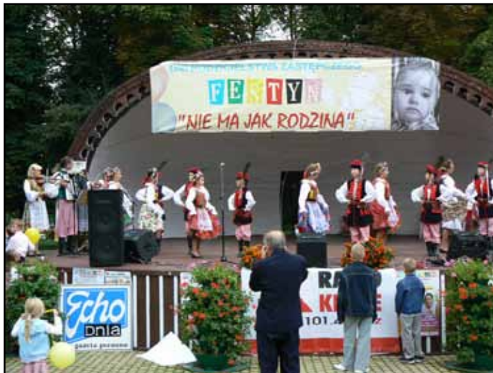
Występ zespołu dziecięcego w Muszli Koncertowej

Corocznie odbywa się festyn rodzinny pn. „Nie ma jak rodzina”, promujący ideę rodzicielstwa zastępczego. Podczas festynu występują znane zespoły dziecięce i młodzieżowe oraz wychowankowie placówek opiekuńczo – wychowawczych. Mieszkańcy powiatu, kuracjusze oraz osoby zainteresowane problemem rodzicielstwa zastępczego mogą wysłuchać ciekawych prelekcji. Można też oddać honorowo krew, a także korzystać z porad lekarskich i bezpłatnych badań profilaktycznych. Popularnością cieszy się pokaz sprzętu strażackiego i samochodów policyjnych oraz pokaz udzielania pierwszej pomocy przedmedycznej.