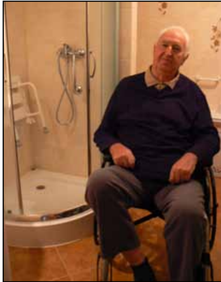
W okresie 2003 – 2010 zlikwidowano 229 barier architektonicznych

WARSZTATY TERAPII ZAJĘCIOWEJ są placówką stwarzającą osobom niepełnosprawnym niezdolnym do podjęcia pracy możliwość rehabilitacji społecznej i zawodowej w zakresie pozyskania lub przywracania umiejętności niezbędnych do podjęcia zatrudnienia. Zmierzają do ogólnego rozwoju i poprawy sprawności niezbędnych do prowadzenia przez osobę niepełnosprawną niezależnego, samodzielnego i aktywnego życia na miarę indywidualnych potrzeb. Warsztaty mogą być organizowane przez fundacje, stowarzyszenia lub przez inne podmioty.