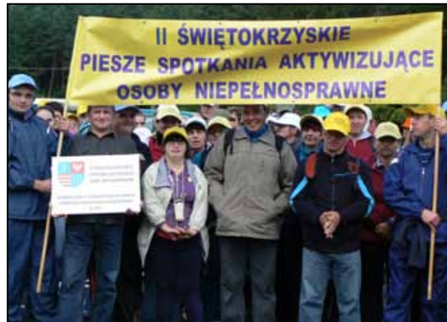
Rajd pieszy osób niepełnosprawnych

Powiatowe Centrum Pomocy Rodzinie sprawuje nadzór nad Warsztatami Terapii Zajęciowej. Na terenie powiatu buskiego działają dwa Warsztaty, które skupiają łącznie 65 uczestników (WTZ Busko – 35 uczestników, WTZ Gnojno – 30 uczestników).