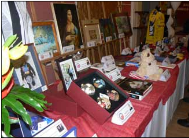
Przedmioty aukcyjne – Bal Dobroczynny 2011

Przedsięwzięciem zasługującym na uwagę są organizowane rokrocznie Bale Dobroczynne. Od 2004 do 2011 roku zorganizowano VIII Balów Dobroczynnych z których dochód przeznaczano na sfinansowanie letniego wypoczynku dzieci i młodzieży z rodzin ubogich i wielodzietnych oraz placówek opiekuńczo – wychowawczych i rodzin zastępczych z terenu powiatu buskiego. Wszystkie bale dobroczynne odbyły się w zajeździe „Panama” w Skorzowie k/Buska – Zdroju. Atrakcją każdej z imprez była aukcja przedmiotów podarowanych przez znane osoby z życia publicznego w kraju.