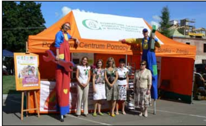
Promocja rodzicielstwa zastępczego podczas dożynek w Stopnicy