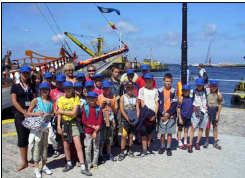
Wypoczynek na polskim wybrzeżu