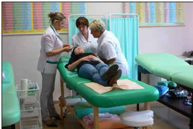
Zajęcia praktyczne na kursie „Kosmetyczka z wizażem i stylizacją paznokci” (2010 rok)