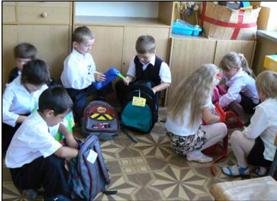
Pierwszoklasiści z wyprawkami

Różnica pomiędzy wpływami a wydatkami przeznaczana była na wyprawki szkolne dla pierwszoklasistów.