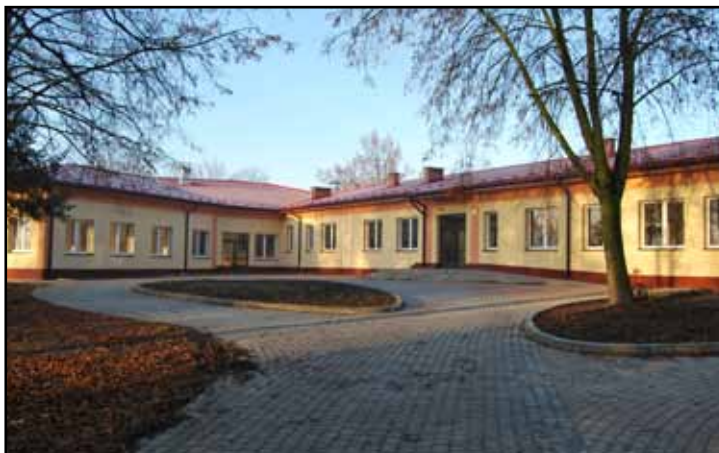
Nowy budynek mieszkalny DPS Gnojno

DPS GNOJNO – przeznaczony jest dla dzieci i młodzieży niepełnosprawnej intelektualnie (chłopcy). Dom dysponuje 102 miejscami.