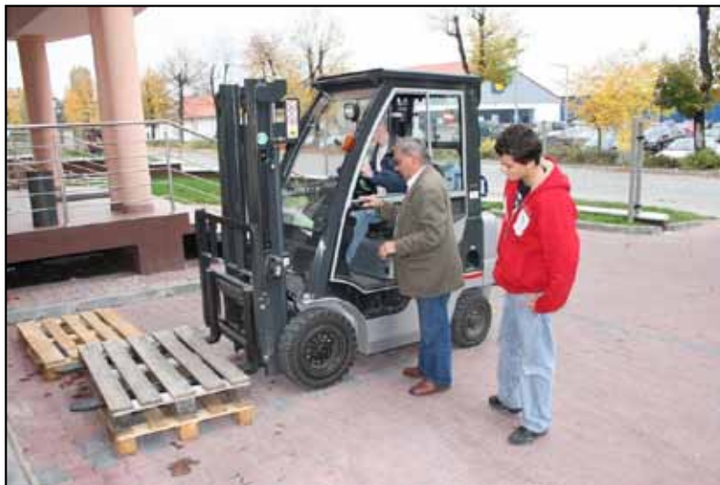
Kurs „Kierowca wózków jezdniowych z napędem silnikowym” (2008 rok)