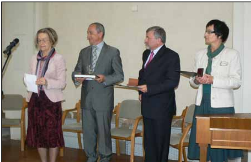
Wręczenie nagrody Lodołamacza. Międzynarodowe Centrum Kultury. Kraków 17.04.2007 r.