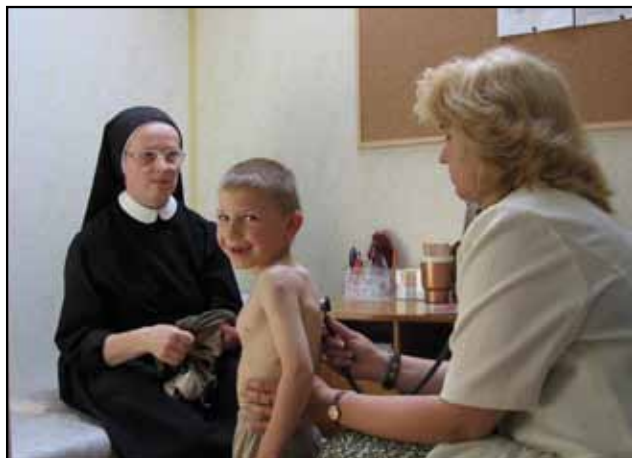
Konsultacje z lekarzem pediatrą

Akcja polega na badaniach profilaktycznych mieszkańców powiatu buskiego. Badania takie odbywają się corocznie od 2003 roku. W „Białych Niedzielach” biorą udział lekarze z buskich szpitali i sanatoriów udzielając bezpłatnych porad i konsultacji medycznych oraz badań lekarskich. Do końca 2010 roku z konsultacji lekarskich skorzystało 4 800 mieszkańców Powiatu. Z pomocy lekarzy korzystały dzieci z rodzin zastępczych i placówek opiekuńczo – wychowawczych. Bezpłatnym badaniom mogli poddać się wszyscy chętni. „Białe Niedziele” odbyły się w gminach: Tuczępy, Gnojno, Pacanów, Wiślica, Busko-Zdrój, Nowy Korczyn.