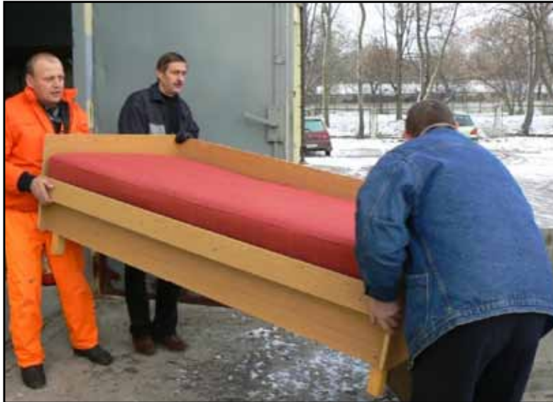
Meble dla ubogiej rodziny podarowane przez jedno z buskich sanatoriów

W okresie minionych siedmiu lat największą pomoc rzeczową w ramach „Banku Drugiej Ręki” otrzymały gminy Pacanów i Gnojno. Największymi dobroczyńcami okazały się buskie sanatoria: 21 Wojskowy Szpital Uzdrawiskowy, Włókniarz, Nida i Uzdrawisko Busko – Zdrój S.A. Łącznie kwota przekazanych podarunków szacowana jest na 80 tys. zł.