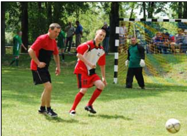
XVIII Świątokrzyski Turniej Piłki Nożnej w Gnojnie

Środki PFRON przyznawane naszemu powiatowi wydatkowane są w każdym roku niemal w 100 %.