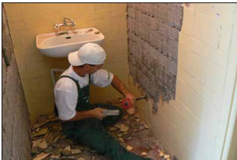
Zajęcia praktyczne na kursie „Technolog robót wykończeniowych w budownictwie” (2009 r.)