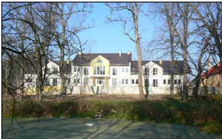
Nowo wybudowany pawilon mieszkalny w Zborowie

DPS GNOJNO – przeznaczony jest dla dzieci i młodzieży niepełnosprawnej intelektualnie (chłopcy). Dom dysponuje 102 miejscami.