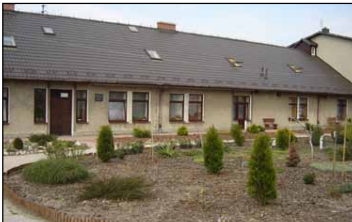
Placówka Opiekuńczo-Wychowawcza w Pacanowie

DOM DZIECKA ZGROMADZENIA SIÓSTR KANONICZEK DUCHA ŚWIĘTEGO IM. BŁOGOSŁAWIONEGO GWIDONA Z MONTPELLIER W PACANOWIE jest niepubliczną placówką opiekuńczo – wychowawczą. Przeznaczony jest dla 30 dzieci. (Umowa z samorządem powiatu na finansowanie jednostki).