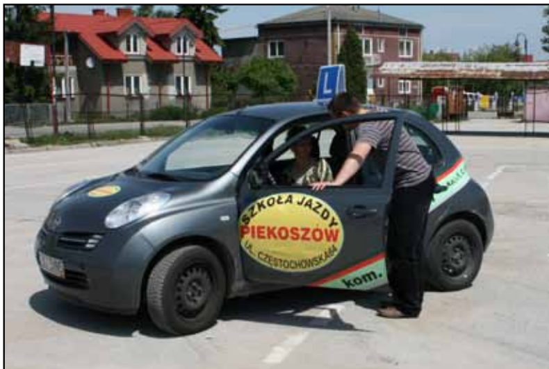
Kurs „Handlowiec z prawem jazdy kat. B” (2009 rok)