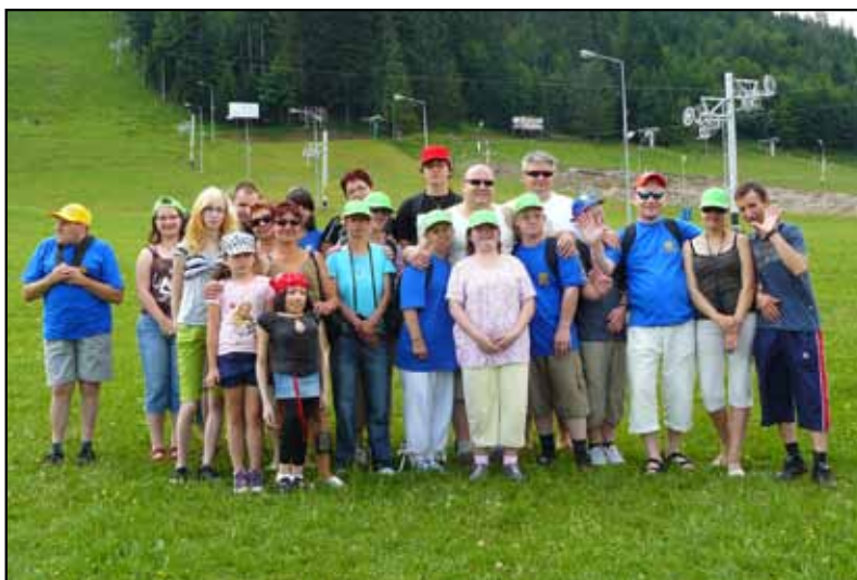
Uczestnicy usługi szkoleniowo – doradczej z elementami rehabilitacji w Zakopanem (2010 rok)