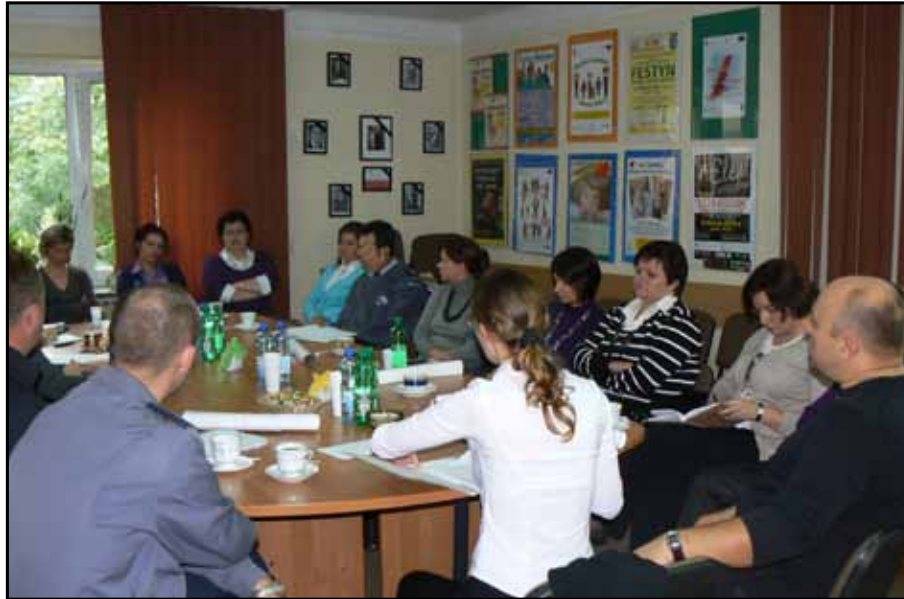
Spotkanie Zespołu Interdyscyplinarnego – 2010 rok

W ramach Powiatowego Programu Wsparcia Dziecka i Rodziny na lata 2006 – 2011, powołano Powiatowy Zespół Interdyscyplinarny, wspierający dziecko i rodzinę, działający w oparciu o system „Żółtej Karty”. W skład Zespołu wchodzi specjalści z różnych dziedzin i instytucji, współpracujący ze sobą w celu efektywnej pomocy osobom w sytuacjach trudnych, kryzysowych.