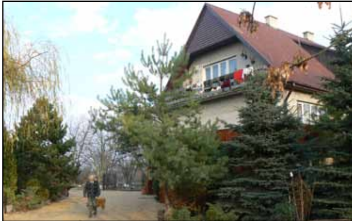
Rodzinny Dom Dziecka w Janinie

DOM DZIECKA ZGROMADZENIA SIÓSTR KANONICZEK DUCHA ŚWIĘTEGO IM. BŁOGOSŁAWIONEGO GWIDONA Z MONTPELLIER W PACANOWIE jest niepubliczną placówką opiekuńczo – wychowawczą. Przeznaczony jest dla 30 dzieci. (Umowa z samorządem powiatu na finansowanie jednostki).