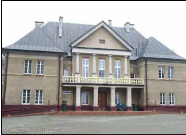
Dom Pomocy Społecznej w Słupi

DPS SŁUPIA – przeznaczony jest dla kobiet przewlekle psychicznie chorych. Dom dysponuje 90 miejscami. Podmiotem prowadzącym jest Zgromadzenie Sióstr Albertynek Posługujących Ubogim ( Umowa samorządu powiatu ze Zgromadzeniem Sióstr na finansowanie ).