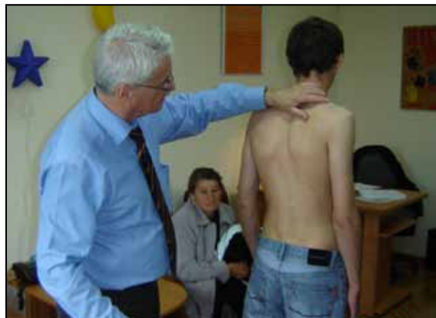
Konsultacje z lekarzem ortopedą

Od 2003 do 2010 roku w ramach akcji mieszkańcom powiatu buskiego bezpłatnych badań i konsultacji udzielali lekarze specjaliści: ortopeda, pediatra, reumatolog, internista, neurolog, pulmonolog, urolog, chirurg.