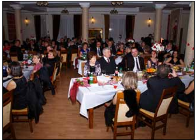
Bal Dobroczynny 2011

Dzięki zebrany m środkom finansowym z aukcji i licytacji znaczna liczba dzieci z rodzin ubogich i wielodzietnych wyjechała na kolonie letnie. Wyjazdy możliwe są do realizacji dzięki współpracy z Caritas Diecezji Kieleckiej i noszą nazwę „Lato Dzieciom”.