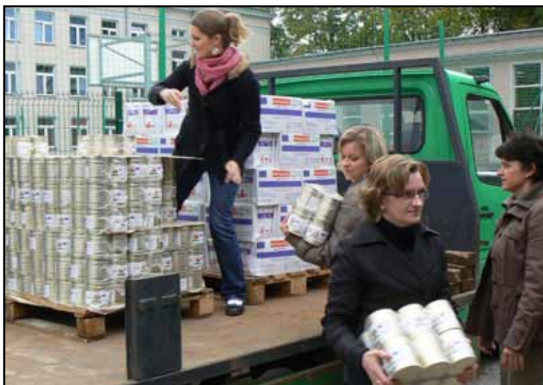
Rozładunek żywności dla rodzin z terenów powodziowych

Powiatowe Centrum Pomocy Rodzinie w Busku – Zdroju było inicjatorem i koordynatorem wielu społecznych akcji kierowanych do rodzin w powiecie buskim. Tak też było z akcją pomocy dla powodźian po kataklizmie jaki dotknął w maju 2010 roku dwie gminy powiatu buskiego: Pacanów i Nowy Korczyn. Przy Powiatowym Centrum Pomocy Rodzinie w Busku Zdroju z inicjatywy Starosty Buskiego zawiązał się komitet „Pomóżmy Powodźianom”. Wolontariusze PCPR zbierali produkty żywnościowe w buskich sklepach z przeznaczeniem dla rodzin powodźian. Odbyła się również zbiórka pieniężna na ten cel. Zebrano 3 234,34 zł (stan na dzień 31.12.2010 r.). Zebrana pomoc rzeczowa została skierowana do powiatu sandomierskiego i staszowskiego, a pomoc finansowa dla rodziny zastępczej w Gminie Nowy Korczyn.