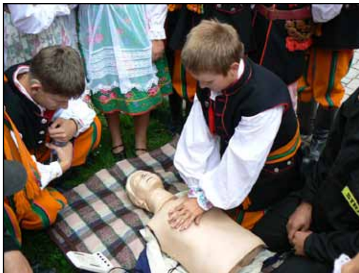
Nauka pomocy przedmedycznej