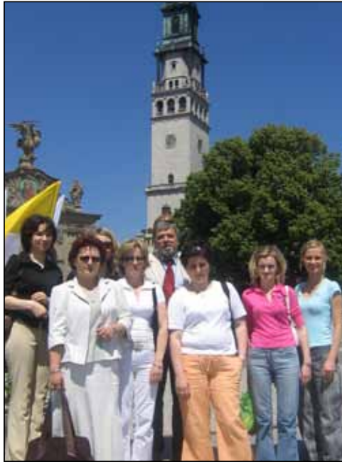
Pracownicy buskiego PCPR w czasie Ogólnopolskiej Konferencji Pracowników Socjalnych na Jasnej Górze w Częstochowie – 2006 rok

Program został zamieszczony jako jeden z pięćdziesięciu najlepszych w Polsce w publikacji powstałej po Ogólnopolskiej Konferencji, która odbyła się w Sejmie Rzeczypospolitej Polskiej. Był on również zaprezentowany na Ogólnopolskiej Konferencji Pracowników Socjalnych w Częstochowie w czerwcu 2006 roku.