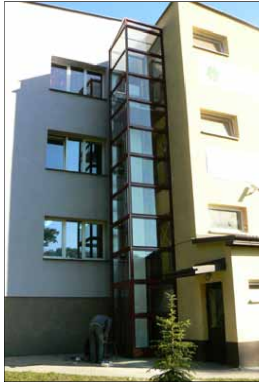
Platforma przy budynku Internatu Zespołu Szkół Techniczno – Informatycznych w Busku - Zdroju, gdzie mieści się siedziba PCPR

W roku 2011 w ramach projektu „NOWY ZAWÓD – NOWY START” Powiatowe Centrum Pomocy Rodzinie w Busku – Zdroju zaktywizuje grupę 150 osób, w tym 100 osób niepełnosprawnych. Beneficjentom zaproponowane będą następujące rodzaje kursów: