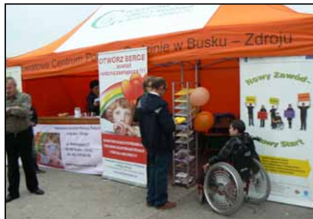
Dni Województwa Świętokrzyskiego – Stopnica 2010

Dzięki akcji propagującej rodzicielstwo zastępcze kilkadziesiąt osób zgłosiło się do Centrum, aby poszerzyć wiedzę na ten temat. Ponadto Powiatowe Centrum Pomocy Rodzinie w Busku–Zdroju rokrocznie uczestniczy w dożynkach gminnych i powiatowych, podczas których promuje działania Centrum oraz Rodzicielstwo Zastępcze.