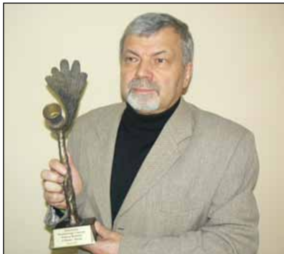
Nagroda Wojewody Świętokrzyskiego 2010 r.

Wyróżnieniem, nie mającym wymiaru materialnego, ale posiadającym duży prestiż jest fakt, iż w dniu 8 października 2010 r. dyrektor Powiatowego Centrum Pomocy Rodzinie w Busku – Zdroju został powołany do Rady Pomocy Społecznej przy Ministerstwie Pracy i Polityki Społecznej. Jest to pierwsza tego typu nominacja z powiatu buskiego. W składzie IV kadencji jest jedynym reprezentantem województwa świętokrzyskiego. W składzie Rady znajduje się 18 osób reprezentujących różne środowiska związane z polską pomocą społeczną.