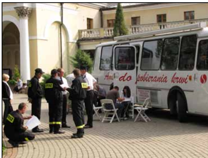
Zbiórka krwi w ramach letniej akcji „Krew Darem Życia” Regionalnego Centrum Krwiodawstwa i Krwiolecznictwa w Kielcach