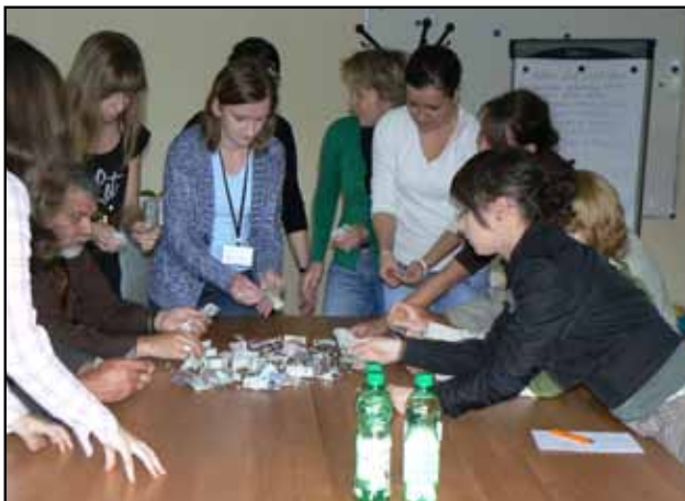
Wolontariusze liczący pieniądze z puszek kwestarskich

Aktywizacja pracy wolontariatu mogła odbywać się m.in. poprzez organizację szkoleń dla wolontariuszy. W latach 2003 – 2010 takich szkoleń odbyło się osiem, z udziałem ponad 200 wolontariuszy. Szkolenia przeprowadziło Świętokrzyskie Centrum Wolontariatu w Kielcach.