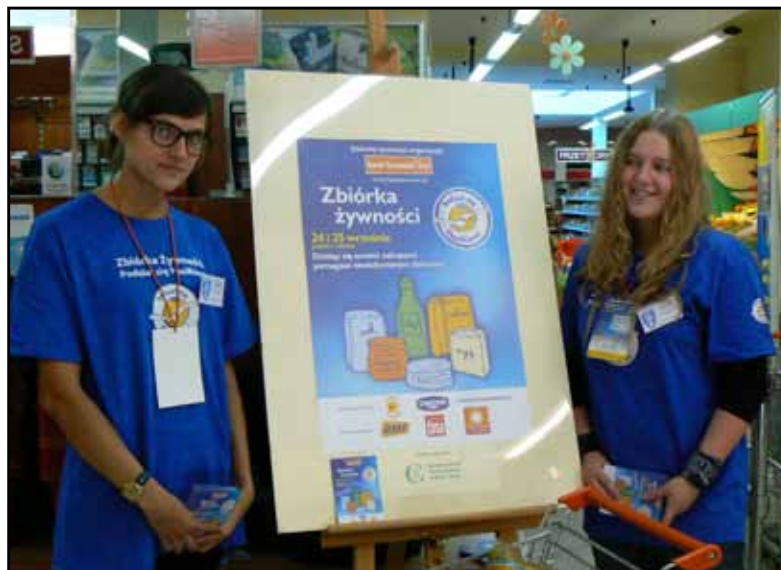
Wolontariuszki PCPR podczas zbiórki w ramach akcji „Podziel się posiłkiem” w sklepie PSS Społem w Busku – Zdroju

Artykuły spożywcze zebrane podczas akcji trafiają do rodzin ubogich i wielodzietnych. Są też przekazywane do rodzin zastępczych. W rozprowadzaniu paczek żywnościowych Centrum współpracuje z Ośrodkami Pomocy Społecznej i Radnymi Powiatu. Do końca roku 2010 zebrano około 10 ton żywności. Po uzyskaniu dodatkowych 20 ton żywności z Federacji Polskich Banków Żywności sporządzono i rozprowadzono 1500 paczek.