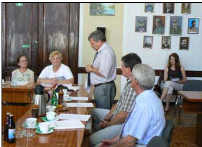
Posiedzenie Społecznej Rady ds. Osób Niepełnosprawnych

Powiatowa Rada jest organem opiniodawczo – doradczym. Do zakresu działania Rady należy inspirowanie przedsięwzięć zmierzających do integracji zawodowej i społecznej osób niepełnosprawnych, opiniowanie projektów powiatowych programów działań na rzecz osób niepełnosprawnych, ocena realizacji programów, opiniowanie projektów uchwał i programów przyjmowanych przez Radę Powiatu pod kątem ich efektów dla osób niepełnosprawnych. Powiatowa Rada składa się z pięciu osób powoływanych spośród przedstawicieli działających na terenie powiatu organizacji pozarządowych, fundacji oraz przedstawicieli jednostek samorządu terytorialnego.