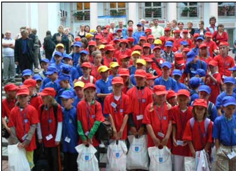
Zbiórka przed wyjazdem na kolonie letnie do Pogorzelicy (2010 rok)