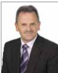
Starosta buski Jerzy Kolarz

Zachęcamy do korzystania z niniejszego opracowania.